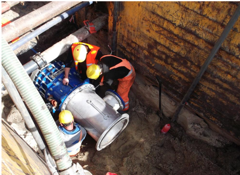
1.3 Komora redukcyjna przy ul. Toruńskiej